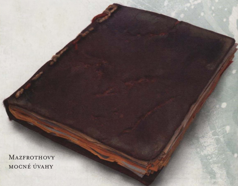
MAZFROTHOVY MOCNÉ ÚVAHY

k Tkanivu přímo, zatímco božští sesilatelé získávají přístup díky svým bohům a víře. Poškození Tkaniva může způsobit nepředstavitelné škody, jako se to stalo například při Moru kouzel v roce 1385 DL, roce Modrého ohně.